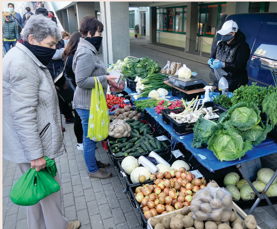
V sobotu 16. 5. 2020 se opět konaly Vinohradské trhy, tentokrát za přísných hygienických nařízení.

VOK bude přistaven jako obvykle v lokalitě Pálavské náměstí (za točnou MHD).